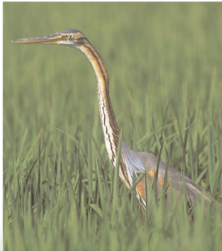
L'agró roig cria entre els canyissars. A l'estiu el podrem veure pescant allà on hi hagi aigües poc fondes i vegetació riberenca per amagar-se.