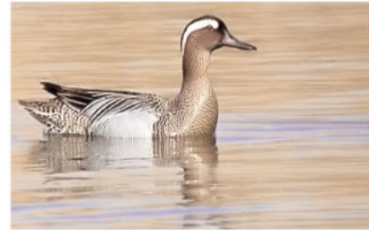
L'ànec roncaire arriba amb la primavera

De març a maig els estanys del Matà esdevenen punt d'aturada de multitud d'ocells migradors, sobretot els dies que la Tramuntana bufa fort i dificulta als ocells el camí cap al nord, obligant-los a buscar recer i aliments als estanys.