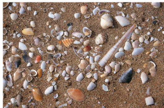
Milers de curculles, troncs i tota mena d'objectes són arrossegats pel mar: és el moment de passejar per la platja.

Sovintegen les llevantades, que porten pluges torrencials que poden inundar la zona i temporals severos que arriben a trencar la platja i omplir-la d'aigua de mar, que penetra fins les llaunes.