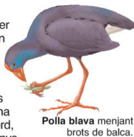
Polla blava menjant brots de balca.

Arriben tètols, batallaires, cames-llargues i molts altres ocells limícoles, ardèides com el martinet ros i l'agró roig, capons, flamencs, fumarells... A la Massona, els cabussos emplomallats fan la dansa nupcial, i hi nien també fotges i cabussets.