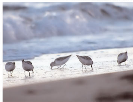
Grup de territs a la platja

Canvien els colors del paisatge: els arbres de les closos agafen tons torrats, els tamaris es fan ocres, floreix de lila el limoni, planta protegida, i la salicòrnia tenyeix les sulsure de color roig.