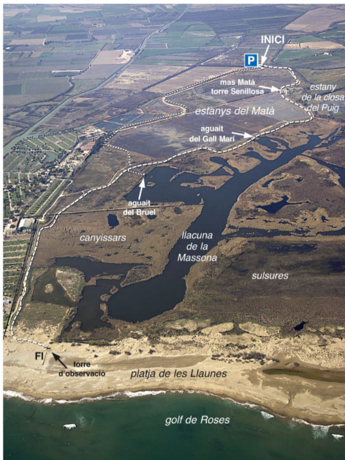
L'itinerari permet visitar a fons els estanys del Matà i recórrer la riba sud de la llacuna de la Massona fins a la platja.