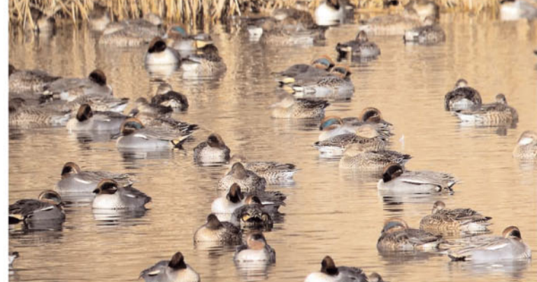
Xarxets a la Massona, des de l'aguait del Bruel.

Els estanys del Matà s'omplen de becadells i fredelugues. A la Massona, com a totes les altres llacunes litorals, milers d'ànecs s'hi concentren per passar-hi els mesos més freds de l'any: sobretot coll-verds, xarxets i cullerots, però també morells, ànecs xiuladors i grisets, així com cabussos, cabussets i corb-marins.