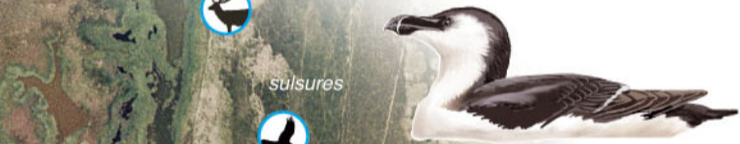
El gavot, ocell marí que visita a l'hivern les aigües de l gulf de Roses, és visible des de la torre d'observació de la platja

A partir de mitjans d'agost comencen a arribar ocells migradors del Nord, i els limícoles es concentren a les aigües ara somes de la Massona. A finals d'estiu les orenetes es concentren sobre els canyissars, per formar dormidors de milers d'exemplars abans de començar el viatge cap a l'Àfrica.