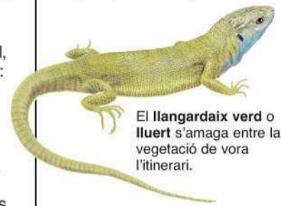
El llangardaix verd o lluert s'amaga entre la vegetació de vora l'itinerari.