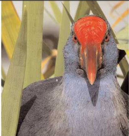
La polla blava o gall marí, un dels molts ocells que han retornat als estanys

Els recs, com ara el Corredor, que voreja bona part del camí, són d'origen artificial, construïts anys enrera per drenar -assecar- la plana agrícola empordanesa. Això no treu que les seves ribes siguin ombrejats refugi de vida i verd, i que puguin nodrir d'aigua nous estanys i velles llanes, com la pròpia Massona.