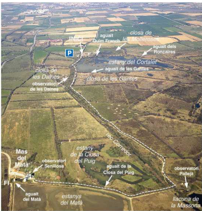
Panoràmica aèria de l'itinerari, on s'aprecia l'entramat de fileres d'arbres de les closos i la forma sinuosa dels estanys. Al fons, Castelló d'Empúries.