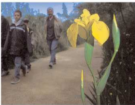
Els lliris grocs, que floreixen al mes d'abril, espurnegen els recs de vora l'itinerari.

Els aiguamolls esdevenen refugi imprescindible per als ocells en migració cap al nord. Al març i l'abril, si la Tramuntana "tanca" els Pirineus, els ocells s'aturen als estanys: limícoles de diverses espècies es concentren a les aiguïes poc