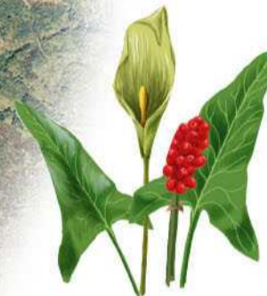
La sarrissa creix prop del camí a la part central de l'itinerari. A l'estiu és especialment visible.