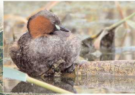
El cabuset, present tot l'any, fa el niu als estanys fins ben entrat l'estiu.

També les petites daines es passegen amb les seves mares i es remullen a les aiguïes de l'estany del Cortalet. En aquests temps els estanys i les llanes es van eixugant, i els ocells pescadors, agrons, bernats, martinets i cigonyes, s'afanyen a capturar els peixos, concentrats als darrers bassiols. Amb la fi de l'estiu, arriben els primers migradors del nord, sobretot ocells limícoles.